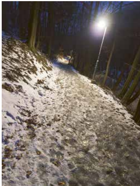
Der steile – im Winter auch vereiste – Weg entlang der Deutschwaldstraße ist leider keine Alternative

Ich bin jung und sportlich, war mit Winterschuhen mit gutem Profil unterwegs, dennoch bin ich 3x ordentlich gestürzt und nun voll blauer Flecken. Ich habe die Steigungen fast nicht geschafft hinauf zu gehen und hatte Angst, den Hang runter zu fallen. Ich habe aber auch wirklich Angst, auf