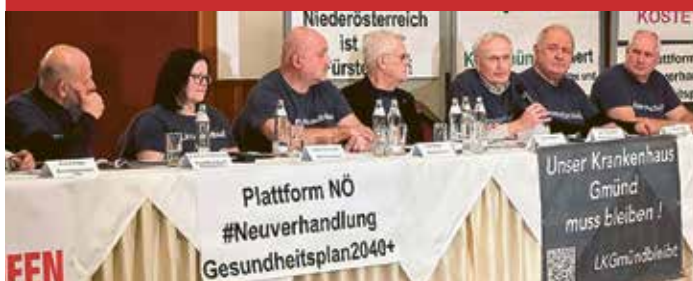
Pressekonferenz in St. Pölten mit der Ankündigung der gemeinsamen Aktion

Treffpunkt in St. Pölten: 10:45 Uhr – vor dem Bahnhof, 11:00 Uhr – Start zum Landhaus Gemeinsame Abfahrt ab Purkersdorf: Bahn: 9:30 Uhr – Bahnhof Purkersdorf-Zentrum Bus: 9:45 Uhr – Kellerwiese (Kostenbeitrag € 4) (vorher: Gablitz Gemeinde) 9:30; Zusteigen in Neupurkersdorf möglich ➤ bitte für Bus anmelden