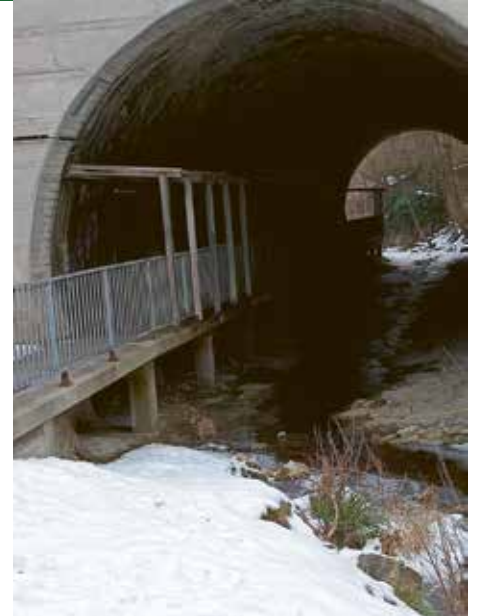
Dieser Durchgang muss erneuert werden

Nun sind die meisten dieser Probleme wohl nicht kurzfristig zu lösen, aber sie hängen alle zusammen, und wenn nun die nicht billige Einzelmaßnahme einer Erneuerung der Fußgängerunterführung gesetzt werden muss, sollten dafür die Zusammenhänge mit den anderen Punkten jedenfalls bedacht werden, um insgesamt einmal zu einer guten Gesamtlösung zu kommen. Daher sollte für die angeführten Punkte ein Verkehrskonzept beauftragt werden. Darüber mehr demnächst!