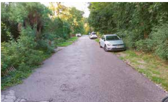
Schuhgasse: Neuasphaltierung um 130.000 € gerade dort?

Wir meinen – und waren da fast alleine, es wurde gegen unsere 4 und 2 weiteren Stimmen beschlossen: die